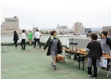
屋上開放「古城公園展望台」(4/6～8.12～15)

講演会は、郷土高岡の歴史などに関わる様々な話題について各研究者よりご紹介いただく郷土学習講座(全3講)を開催しました。そのほか、桜の開花時期に合わせた屋上開放「古城公園展望台」(4/6～8.12～15)、当館茶室「松聲庵」で行う呈茶の会(4/7、11/17)、古文書講座「初めての古文書教室」(9～11月。全6講)を開催するなど、今年度も多くの方々に博物館へご来館いただきました。