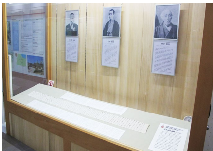
お宝コーナー「吉田松陰と佐久間象山の動向を伝える坪井信良書簡」

平成30年度、本展示コーナーでは4つのミニ展示を行いました。「懐かしのレトロゲーム展」(会期：4/1～4/15)では、懐かしいゲームウォッチやファミコンなどの電子ゲーム類(計20点)を展示・紹介しました。「新発見！高岡共立銀行宛の渋沢栄一書簡」(会期：6/30～8/26)では、“近代日本資本主義の父”渋沢栄一(1840～1931)が、現在“赤レンガの銀行”として親しまれている高岡共立銀行(1954年より富山銀行本店)の支配人に宛てた新発見の書簡について展示・紹介しました。「吉田松陰と佐久間象山の動向を伝える坪井信良書簡」(会期：10/6～12/9)では、高岡の産婦人科医・佐渡家出身で福井藩医を経て幕府奥医師となった蘭方医・坪井信良が、義伯父に宛てて幕末の動乱などを伝えた書簡について展示・紹介しました。「焼き物を楽しむ ー高岡ゆかりの陶芸資料からー」(会期：H31.1/12～3/10)では、当館収蔵の郷土色豊かな高岡ゆかりの陶芸資料(計6件9点)を展示・紹介しました。