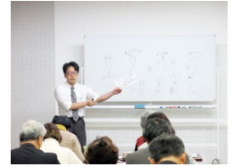
古文書講座「初めての古文書教室」