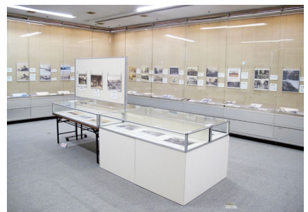
特別展「古写真にみる高岡」