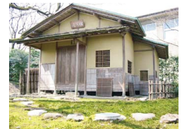
茶室「松聲庵」 ※1日4,000円(税別)で利用可