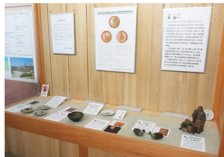
お宝コーナー「焼き物を楽しむ ー高岡ゆかりの陶芸資料ー」

館蔵品展「昔の道具と暮らし」(会期：4/1～5/6)では、当館が収蔵する衣・食・住をはじめとした古い生活道具類「民具」(計141件163点)に焦点をあて、それぞれの民具がもつ歴史や用途に加え、その時代を生き抜いた人々の暮らしぶりについて展示・紹介しました。特別展「古写真にみる高岡」(会期：6/2～8/19)では、当館が近年新たに収蔵した写真絵葉書を中心に、高岡の古写真(178件240点)を展示・紹介しました。企画展「堀田一族と伏木 ー堀田善衛生誕100年・日本遺産「北前船寄港地」追加認定記念ー」(会期：9/8～11/25)では、堀田善衛の生誕100年の記念、及び先日伏木が日本遺産に追加認定されたことを記念して、善衛を育んだ伏木と堀田一族(八坂家・稲垣家・野口家)について歴史資料(計175件225点)を中心に展示・紹介しました。現在は、館蔵品展「昔の道具と暮らし」(H31.2/2～)を開催中です(次年度5月6日まで開催)。