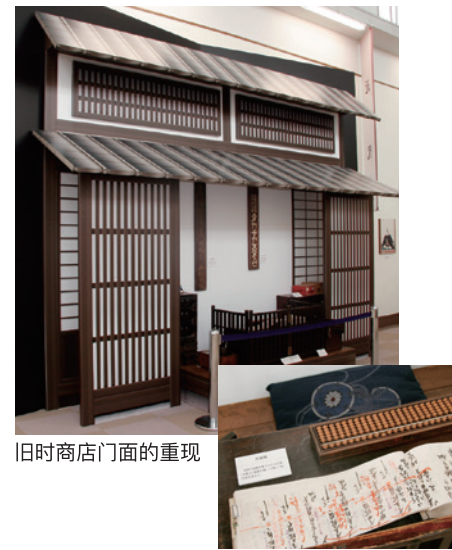
旧时商店门面的重现