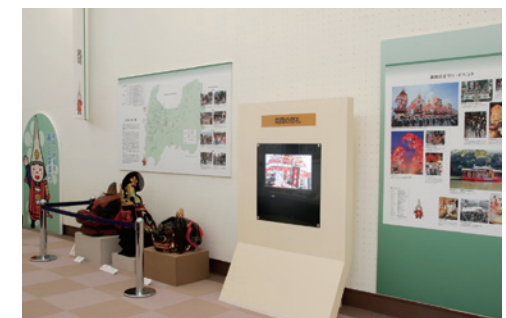
狮子舞等高冈的盛大节日祭