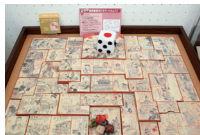
体验角落: “高冈市繁盛双六游戏: 一起玩玩看!”