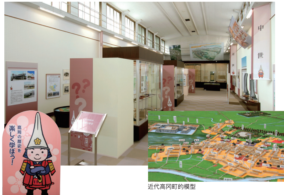
近代高冈町的模型

高冈是古代越中国国府的所在地。庆长14年(1609), 加贺藩前田家第二代家主建立高冈城, 开启了高冈城下镇的历史。因“一国一城令”废城后, 高冈进而发展成一所工商并茂的城市。