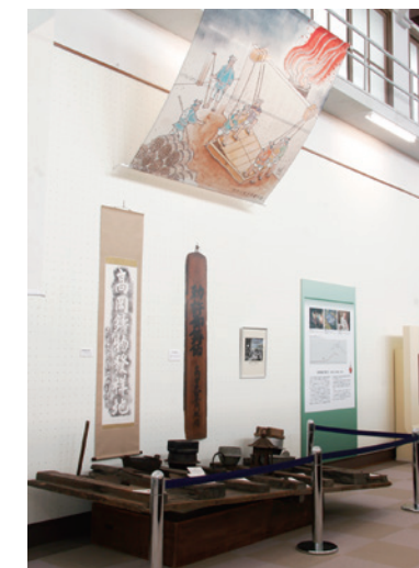
大型风箱的脚踏板展示