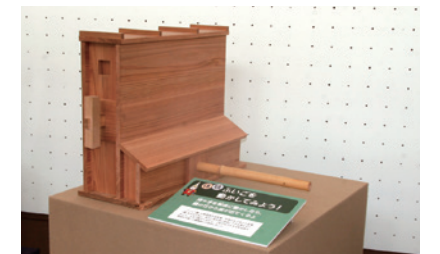
体验角落: “试着操作手动式风箱吧!”