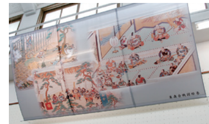
挂毯“未森合战图绘卷”