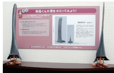
体验角落: “试着戴戴利长君的头盔吧!”