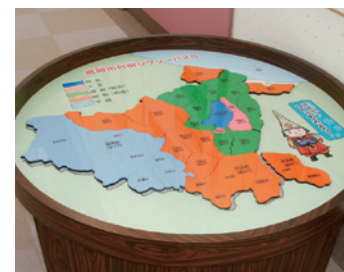
体验角落: “七巧拼图: 高冈的合并过程”