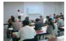
古文書講座 「初めての古文書教室」

・申込方法：①電話 ②FAX ③メール いずれかの方法で、住所・氏名・電話番号・親しむ会入会の有無をお知らせのうえ、お申し込みください。