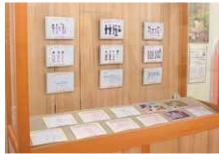
お宝コーナー「アニメ映画《この世界の片隅に》パネル展」

企画展「幕末維新風雲通信 ～将軍家医師・坪井信良より兄佐渡養順への手紙～」(会期：4/1～5/8)では、高岡最古の町医者・佐渡家の由緒書や、坪井信良より高岡の兄佐渡養順に宛てた書翰類などの資料(計58件86点)を展示・紹介しました。特別展「高岡市平和都市宣言10周年記念 戦時下の暮らし」(会期：7/23～10/10)では、高岡市が「平和都市宣言」を議決してから今年で10周年目を迎えたことを記念し、戦時下での生活資料など(計117件261点)を展示・紹介しました。企画展「緊急延長！新たに寄贈された戦時下資料」(会期：10/22～H29.1/15)では、特別展で公開できなかった資料及び、会期中に新たに寄贈された戦時下関連資料(計38件102点)を緊急延長展示という形で紹介しました。現在は、館藏品展「新資料展」(H29.2/4～)を開催中です(次年度5月7日まで開催)。