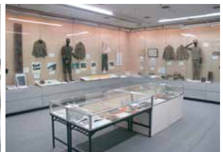
特別展「高岡市平和都市宣言10周年記念 戦時下の暮らし」