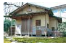
茶室「松聲庵」 ※1日4,320円(税込)で利用可