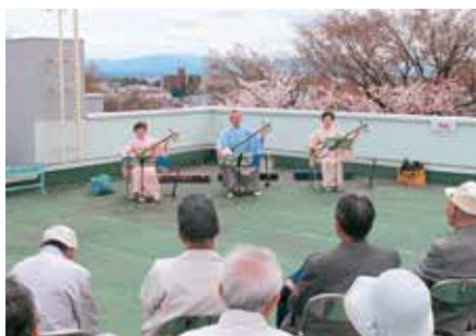
屋上開放「古城公園展望台」(4/8～10)

講演会は、「高岡を知る」をテーマに、郷土高岡の歴史などに関わる様々な話題について各研究者よりご紹介いただく郷土学習講座(全3講)を開催しました。そのほか、桜の開花時期に合わせた屋上開放「古城公園展望台」(4/8～10)、毎月1回のミニ講座「高岡のみじかい話」(計12回)、当館茶室「松聲庵」で行う呈茶の会(4/9、11/5)、古文書講座「初めての古文書教室」(10～12月。全6講)を開催するなど、今年度も多くの方々に博物館へご来館いただきました。