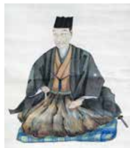
五十嵐篤好画像 (11代政雄筆、五十嵐家蔵)