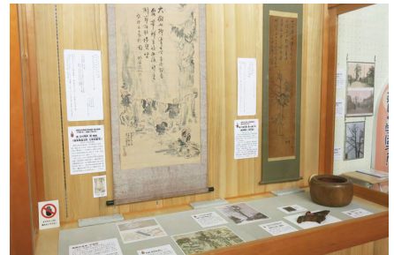
「高岡の名木・七本杉」 (R7.1/18～3/16)