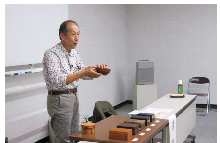
伝統産業講習会 「漆器の塗り工程と取扱い」(10/12)