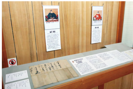
「原本新発見！前田利長を見舞う徳川秀忠書状」 (11/9～12/22)