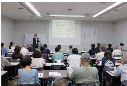
郷土学習講座「歴史地震に学ぶーとやまの災害とその教訓ー」(6/8)

講演・講習会では、郷土高岡に関わる様々な話題について各研究者よりご紹介いただく郷土学習講座（全3講。6/8、9/7、11/30）や特別展講演会（8/3）、伝統産業講習会（10/12）、古文書講座（9～11月。全6講）などを行いました。そのほか、当館学芸員が小・中学生向けの自由研究・調べ学習をサポートする「教えて！学芸員」（8/1～8/31）、桜の開花時期にあわせた屋上開放「古城公園展望台」（4/5～7、4/13～14）、当館茶室「松聲庵」で行う呈茶の会（4/6、10/26）を開催するなど、今年度も多くの方々に博物館へご来館いただきました。