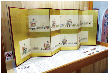
「新発見！最古の御車山絵画資料」 (8/24～10/27)

今年度、本展示コーナーでは5つのミニ展示を行いました。「高岡の春」（会期：前年度3/16～5/12）では、当館が所蔵する高岡の「春」を描いた各種の資料を展示・紹介しました。「博物館所蔵の國泰寺資料」（会期：6/8～8/12）では、令和6年（2024）が高岡市太田の國泰寺（臨済宗國泰寺派大本山）の開山国師生誕750年の節目にあたることから、初公開となる山岡鉄舟書簡（八坂金平宛）など当館収蔵の國泰寺関連資料を展示・紹介しました。「新発見！最古の御車山絵画資料」（会期：8/24～10/27）では、新発見となる国指定重要有形・無形民俗文化財「高岡御車山祭」の行列を描いた最古と思われる屏風を展示・紹介しました。「原本新発見！前田利長を見舞う徳川秀忠書状」（会期：11/9～12/22）では、原本新発見となる高岡城で病臥する利長に対する将軍秀忠の見舞状を展示・紹介しました。現在開催中の「高岡の名木・七本杉」（会期：R7.1/18～3/16）では、かつて高岡駅前（末広町通り）にあった巨木・七本杉を描いた絵画や写真絵葉書、伐採された古材を使用した火鉢や置物台などを展示し、高岡の名木を紹介しています。