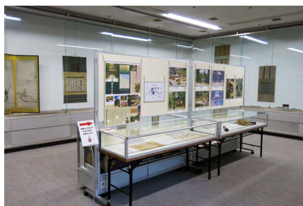
特別展「開山国師生誕750年記念 國泰寺宝物展」(7/27～10/6)